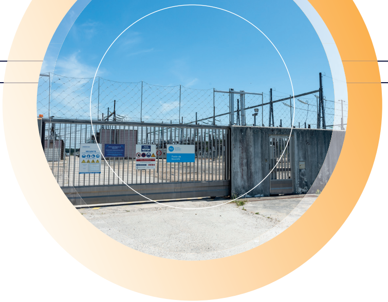
Poste de transformation électrique de Saucats